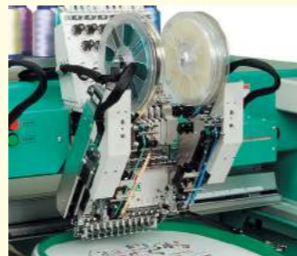
Pailleteneinrichtung Twin Type Verarbeiten von zwei Paillettenarten mit schnellem Wechsel.