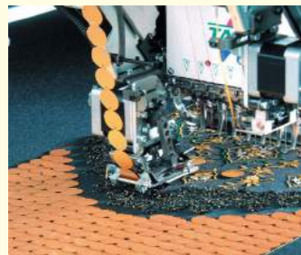
Pailleteneinrichtung IV Verarbeiten von verschiedenen Pailletten z.B. mit kleinem oder großem Durchmesser, ungleichförmige oder exzentrische.